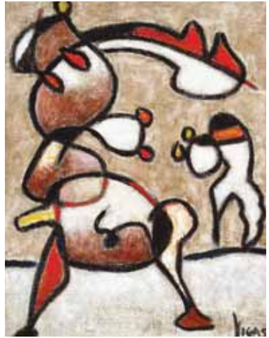
Oswaldo Vigas En el camino siempre juntos III, Óleo sobre yute 90 x 70 cm

Como un homenaje a nuestros artistas plásticos, la Embajada de los Estados Unidos de América nos solicitó una exposición representativa del Arte Contemporáneo Venezolano. Quisimos entonces mostrar las obras que identifican a un conjunto de artistas plásticos de distintas generaciones que permitan, a través de este breve recorrido, seguir el acontecer plástico venezolano de los últimos 50 años.