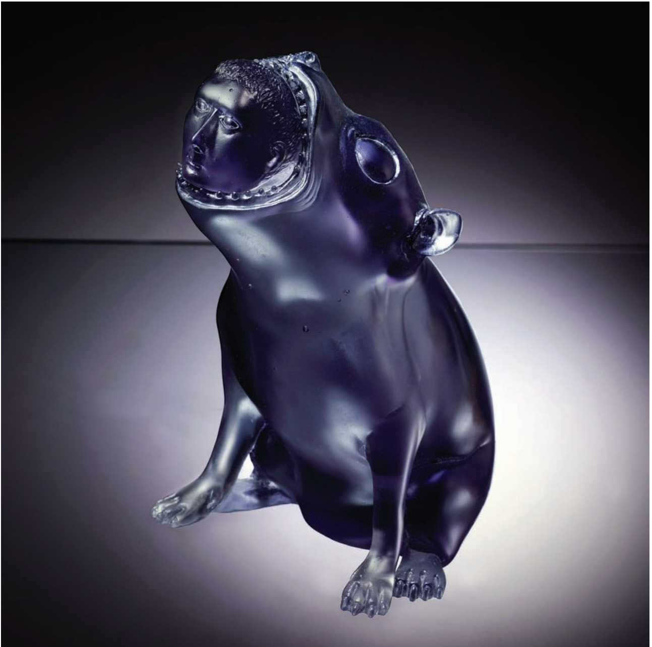
7. Yuck. 2009. Vaciado en vidrio, 21 x 14 x 13 cm