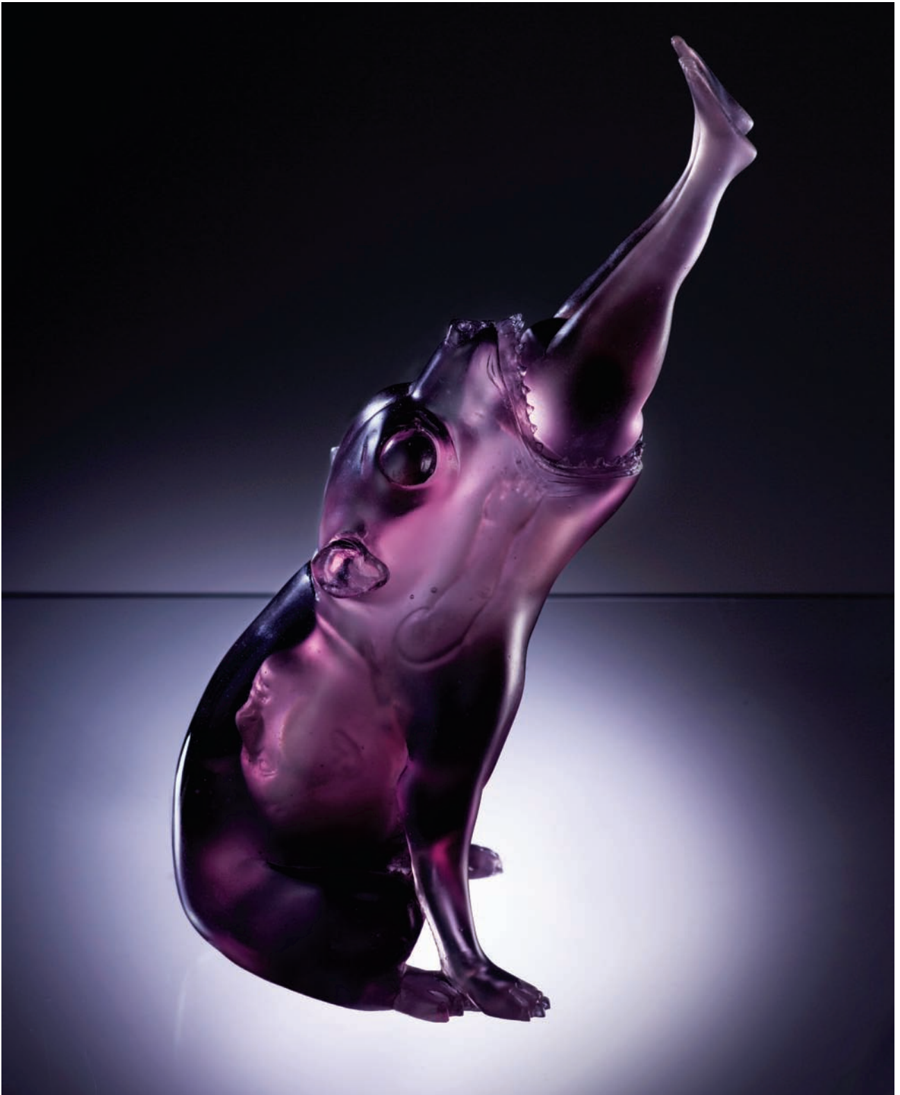
6. Yummie. 2009. Vaciado en vidrio, 29 x 16 x 13 cm