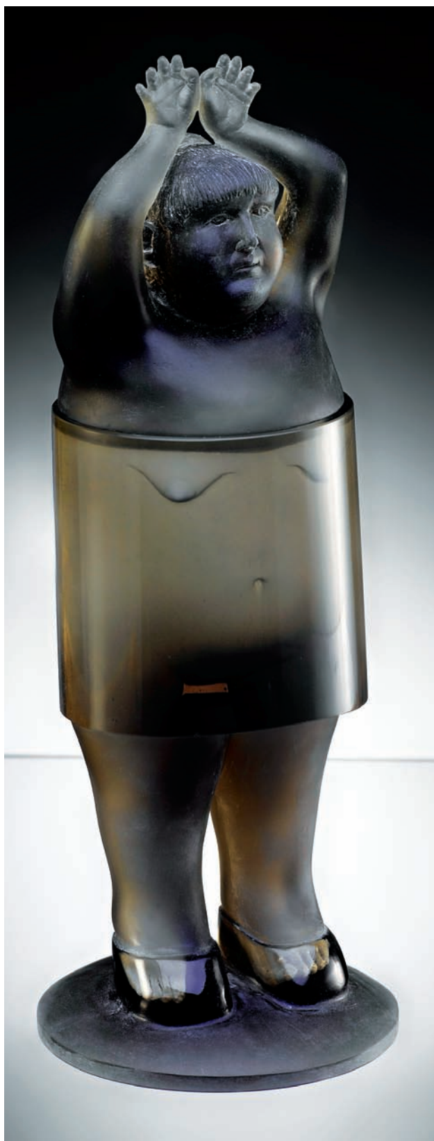
5. Suzie. 2008. Vaciado en vidrio, 29 x 10 x 10 cm