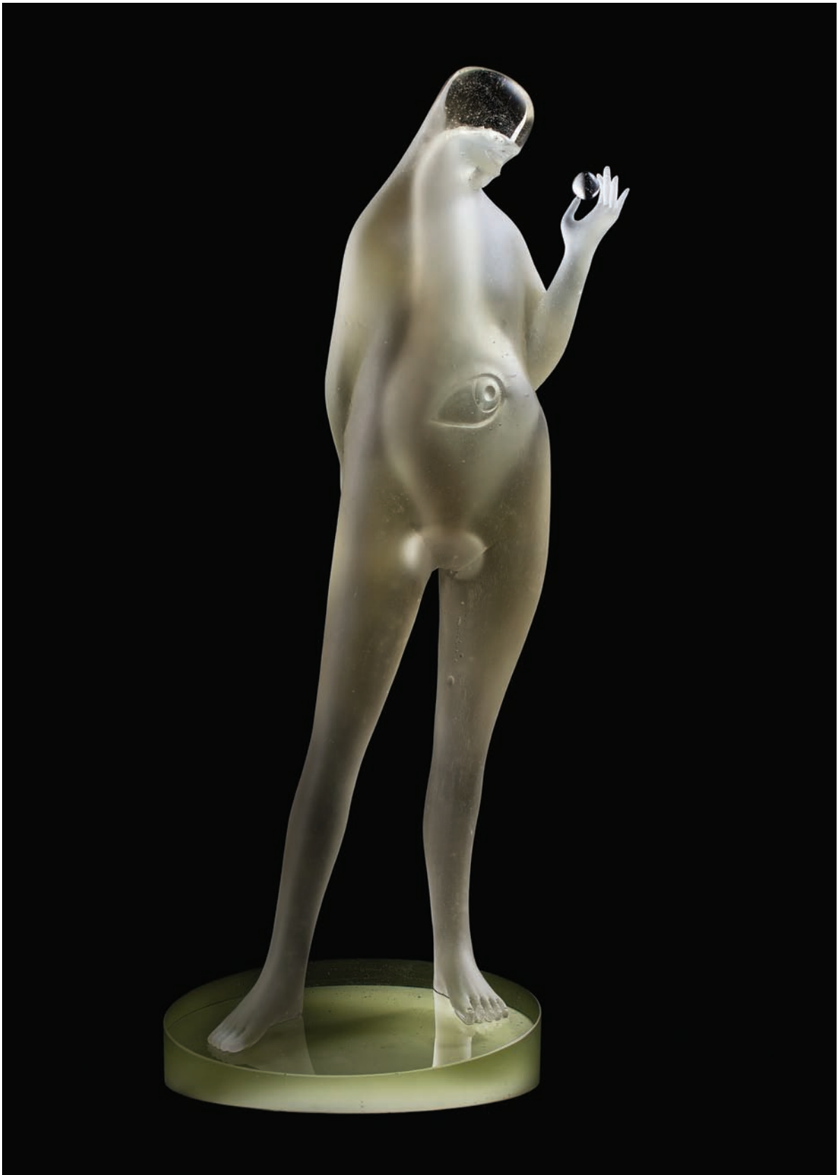
4. Eva. 2013. Vaciado en vidrio, 70 x 30 x 25 cm