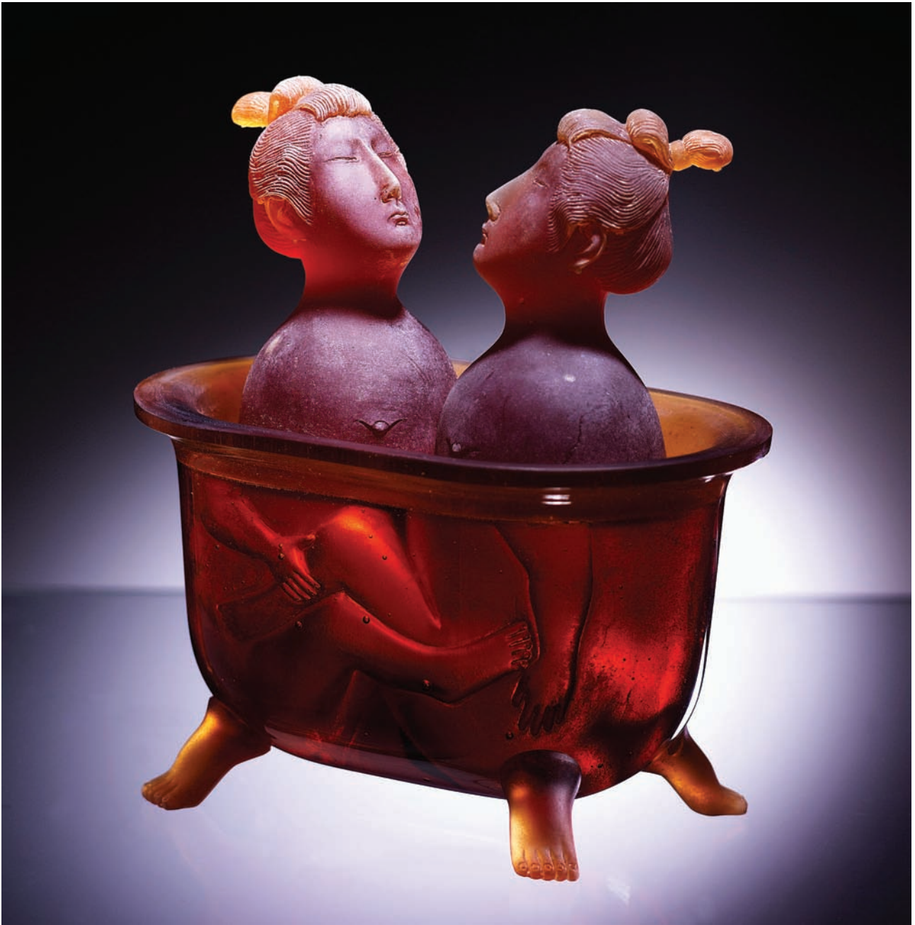
1. Hot bath. 2009. Vaciado en vidrio, 18 x 18 x 11 cm